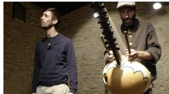
Conteur et musicien pour semer les mots de Jean Giono.