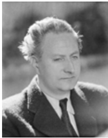
Jean Giono L'auteur

Fils unique d'une famille modeste, il quitte l'école à 16 ans. En 1915, il est mobilisé et découvre l'horreur de la guerre. Traumatisé, il sera pacifiste à vie. Il se plonge alors de manière frénétique dans l'écriture. Il publie des poèmes dans des revues et écrit en 1927 son roman fondateur, Naissance de L'Odyssée . En 1929, il publie La Colline et Un de Baumugnes . Il décide de vivre de sa plume. En 1939, il milite pour la paix. Il est mobilisé. Il sera arrêté pour cause de pacifisme. Surnommé « le voyageur immobile », avec la publication du Hussard sur le toit , le monde littéraire le considère à nouveau. Entre humanisme et révolte, l'œuvre de Giono est dense et variée.