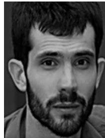
Baptiste Relat Metteur en scène

Fils unique d'une famille modeste, il quitte l'école à 16 ans. En 1915, il est mobilisé et découvre l'horreur de la guerre. Traumatisé, il sera pacifiste à vie. Il se plonge alors de manière frénétique dans l'écriture. Il publie des poèmes dans des revues et écrit en 1927 son roman fondateur, Naissance de L'Odyssée . En 1929, il publie La Colline et Un de Baumugnes . Il décide de vivre de sa plume. En 1939, il milite pour la paix. Il est mobilisé. Il sera arrêté pour cause de pacifisme. Surnommé « le voyageur immobile », avec la publication du Hussard sur le toit , le monde littéraire le considère à nouveau. Entre humanisme et révolte, l'œuvre de Giono est dense et variée.